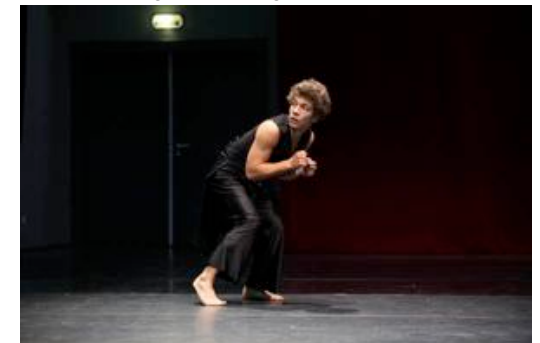
« Le Faune » de Michel Kelemenis par Grenade

Un animal dans un corps d'homme : c'est la dialectique qui a accompagné Michel Kelemenis dans l'écriture de Faune Fomitch en 1988, suivant l'observation, par l'expérimentation, de l'état double et simultané de danseur-chorégraphe. Le solo est élaboré en référence à ce moment historique où Vaslav Fomitch Nijinski entre en chorégraphie et bouleverse sa propre image de danseur classique virtuose avec L'après-midi d'un faune , atteignant au scandale. Sa transposition vers un être adolescent se nourrit d'une autre force, universelle, celle du passage d'un âge à l'autre, que le solo, par la responsabilisation qu'il implique, reconnaît, accepte et accompagne.