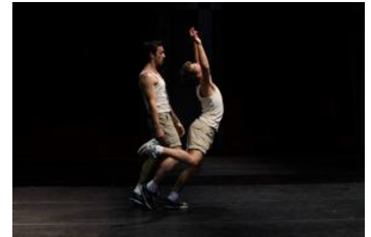
« Mammame » Jean-Claude Gallotta par Grenade