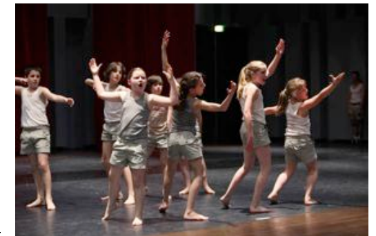
« Mammame » de Jean-Claude Gallotta par Grenade

Elle a fait l'objet d'adaptations cinématographiques par Raoul Ruiz ( Mammame , 1986) et par Claude Mouriéras ( Un chant presque éteint , 1986).