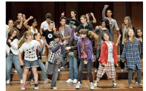
« The Show must go On » de Jérôme Bel par Grenade