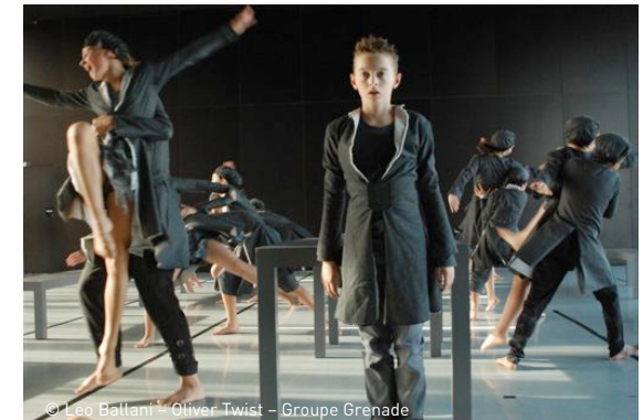
© Leo Ballani - Oliver Twist - Groupe Grenade