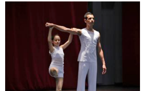
« Codex » Philippe Decouflé par Grenade

C'est le spectacle de Codex qui met définitivement sur orbite la planète Decouflé avec son armée de microbes à palmes, ses créatures aux excroissances insolites. En 20 ans d'existence, Codex aura donné naissance à un film puis aux relectures Décodex (1995) puis Tricodex (2004).