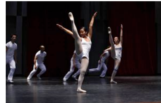
Vers un Pays Sage » de Jean-Christophe Maillot par Grenade

Miniatures ou la relation intuitive avec la musique.