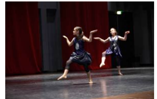
« Marché Noir » de Angelin Preljocaj par Grenade