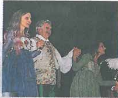
« Les Femmes savantes », mises en scène par Marc Paquien : satire et rires à tous les étages !

Les terrestres ardeurs s'opposent aux doctes savoirs et le commerce des sens aux plaisirs de la philosophie. « Il n'est pas bien honnête qu'une femme étudie et sache tant de choses », lâche le savoureux