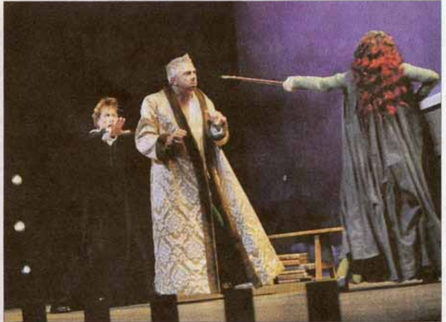
■ Hier soir, sur scène, des "Femmes savantes" qui glorifient Molière.

Dans la maison de Chrysale, chef de famille dont l'autorité n'est pas la vertu première, et de Philaminte, sa femme qui élève désir de science au rang de religion et prend les règles du grammairien Vaugelas pour Bible, le spectacle de Marc Paquien se déguste comme un plat raffiné. Bien servies par les comé-