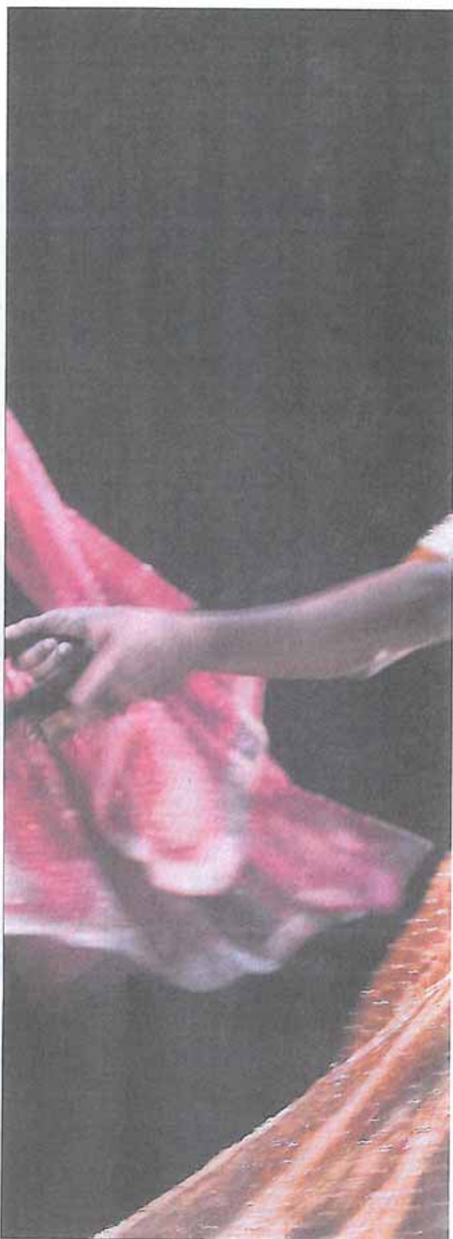
La «bombe» Chicos Mambo, ce soir, sur la scène du CAPE à E

2006 : Nouveau spectacle : Méli-Mélo II le retour