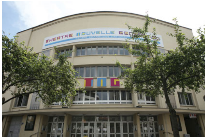
Centre Dramatique National de Lyon